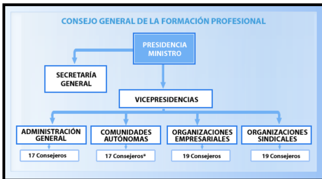
Cuadro I.

El Consejo General de Formación Profesional es un órgano consultivo y de participación institucional de las Administraciones públicas y de asesoramiento al gobierno en materia de formación profesional. Esta formado por representantes de las organizaciones sindicales, organizaciones empresariales y de la Administración del Estado, concretamente del Ministerio de Educación y de Trabajo y Seguridad Social.